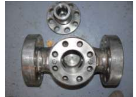
Cuerpo de válvula reacondicionado