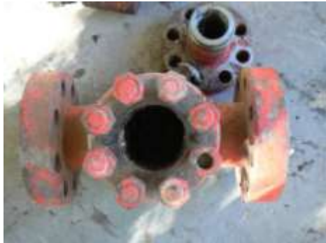
Desarme cuerpo de válvula