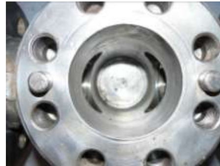
Interior de cuerpo reacondicionado