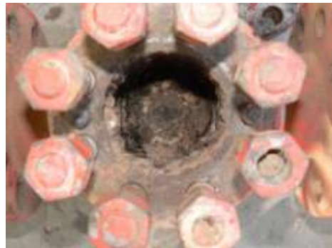
Cuerpo Vista interior